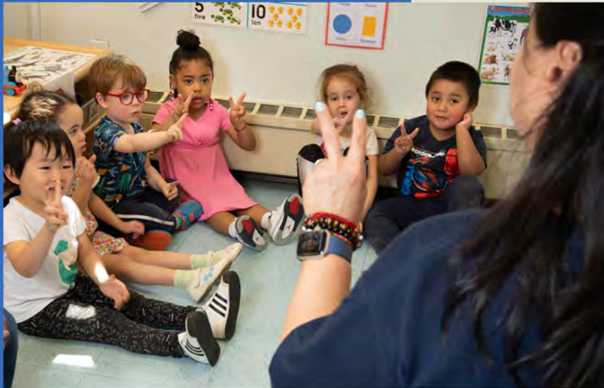
Message Board Pizarra de Mensajes

Área de reunión donde nos sentamos en grupo para hablar sobre el día que tenemos por delante.