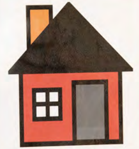
Family Area Área de Familia

Family area where we can pretend and play with each other. Área familiar donde podemos fingir y jugar entre nosotros.