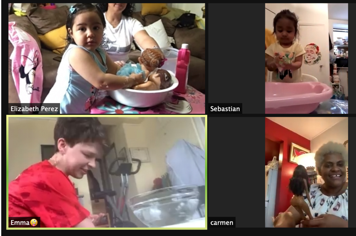
Lavar las muñecas, Actividades para la semana del 31 de mayo de 2021