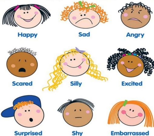
Tabla de Sentimientos

Para finalizar la actividad, cada niño tendrá la oportunidad de hacer un dibujo de sus propios sentimientos o los sentimientos de otros.